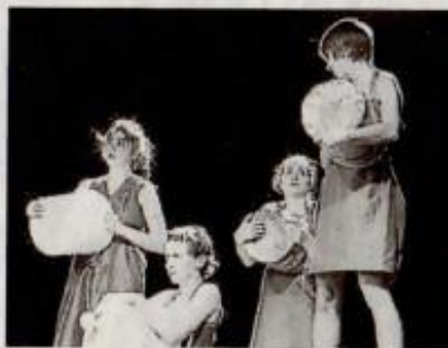
Les quatre Cassandre essayent de sauver Troie.

Les spectateurs à la sortie étaient unanimes : « Quel professionnalisme pour ces quatre comédiennes qui se donnent à fond pour nous faire comprendre un épisode de la mythologie grecque » ; « C'est du vrai théâtre de rue avec une mise en scène moderne où le déserteur de Boris Vian, un peu transformé, est chanté. »