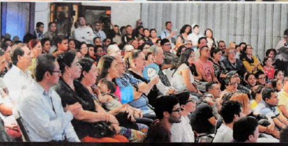
SONRIENDO EN UNA NOCHE TEATRAL Durante la puesta en escena, las actrices francesas caracterizaban personajes de hombres y mujeres de la época de Troya, como el príncipe Paris. El público se carcajeó por los diálogos, pues a pesar de escucharse un español mezclado con francés el mensaje fue contundente.