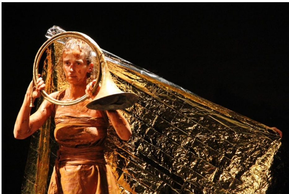
Cassandra à Querétaro, Mexique 2017

Extrait de l' Eneide , de Virgile Traduction originale d'Eric Duchâtel.