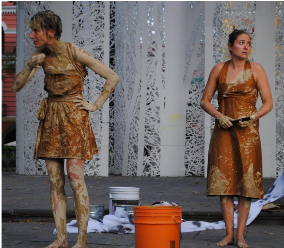
Cassandre à Puebla, Mexique, 2017

Malgré le fait qu'elles ont été, il y a plus de quatre mille ans, condamnées par Apollon à prédire l'avenir sans être crues, ces quatre Cassandre vont de place en place afin de faire ce qu'elles ont toujours fait : prévenir. Mais le temps a passé depuis la chute de Troie, d'autres orages grondent aujourd'hui et chacune essaie de lutter à sa manière, avec les forces qui lui restent. Même si elles ne sont pas toujours d'accord sur le pourquoi du comment raconter l'histoire catastrophique de leur vie ; même si elles ne cessent de se heurter toujours aux mêmes murs – qu'ils soient historiques, idéologiques ou politiques ; même si leur combat est dérisoire et vain ; elles persistent. Elles nous rappellent que nous avons le pouvoir de résister à l'oppression, à la mauvaise foi et à la – semble-t-il – inéluctable marche du monde.